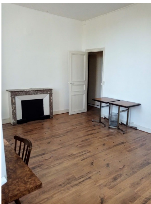
Some photos of the Marnay-sur-Seine City Hall Exhibition - Studio